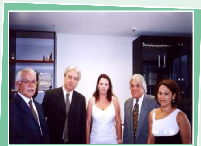
Equipe representante dos trabalhadores no julgamento do tíquete dos Comissários e Consignatários

Assessoramento e Contabilidades: o processo para a concessão do vale refeição foi iniciado em agosto/2005 e extremamente desgastante para a categoria, que por não ter a convenção acordada, não recebia o aumento em seus salários há dois anos consecutivos. Após um intensa batalha finalmente foi realizado um acordo com o sindicato patronal, e assinadas as Convenções Coletivas dos últimos três anos: 2005 - 2006 e 2007. Desta forma, conquistamos o Vale-Alimentação/Refeição, que não foi no valor desejado, mas não mediremos esforços para continuar buscando o valor almejado.