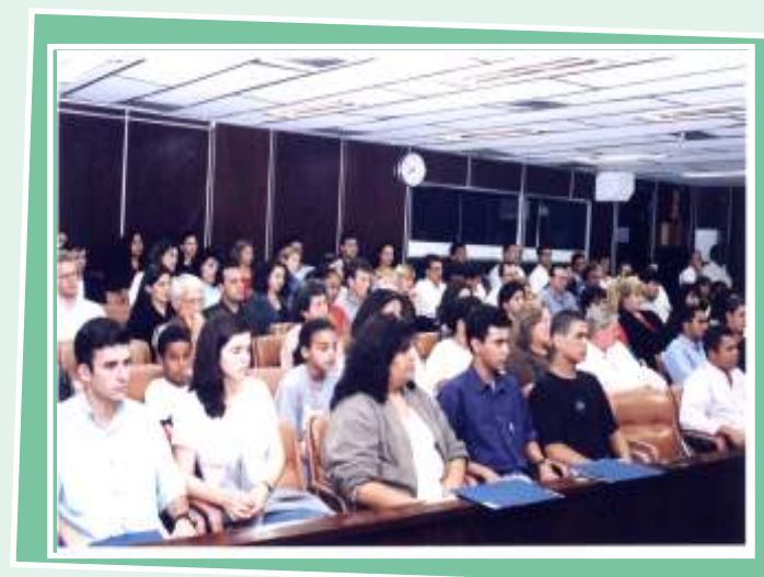
4º Encontro Regional da Categoria EAA - 1999