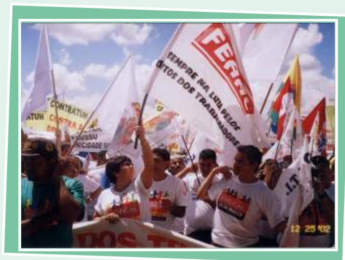
Manifestação sobre a Reforma Sindical - Brasília 2003