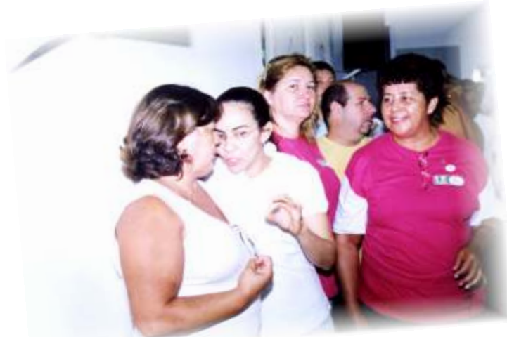
Evento no Sindiato das Costureiras no Dia Internacional da Mulher