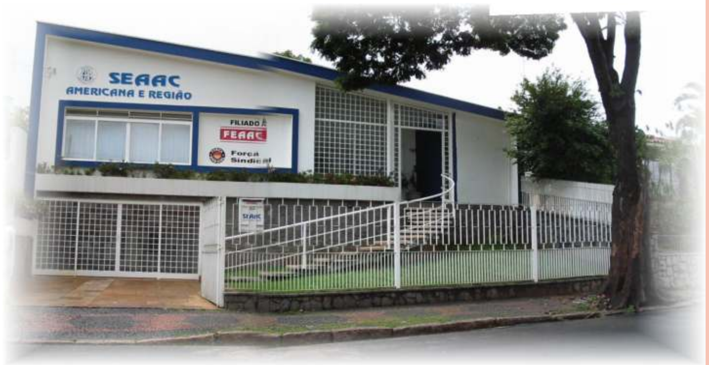
Sede do SEAAC em Americana

O Seaac conta hoje com boas instalações, fruto do trabalho integrado de toda diretoria, para que o trabalhador pudesse contar com um lugar agradável e bem estruturado, de fácil acesso, para atender suas necessidades, esclarecer suas dúvidas, além de despertar seu orgulho e sua vontade de participar do dia a dia do Sindicato, onde ele e seus dependentes são recebidos com toda atenção.