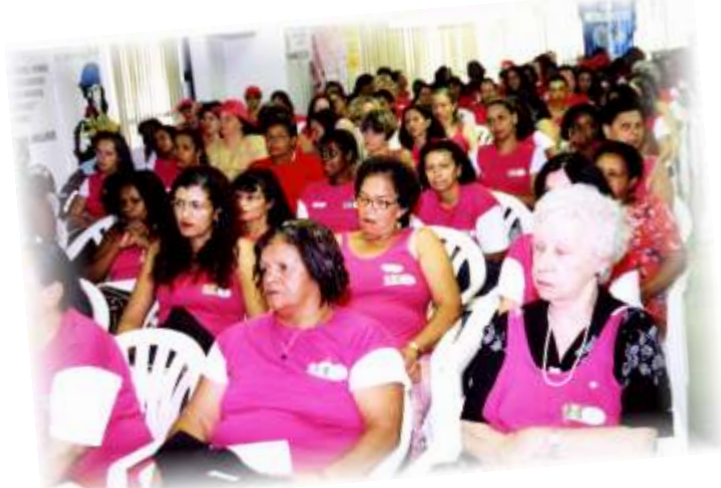
Dia Internacional da Mulher - Força Sindical