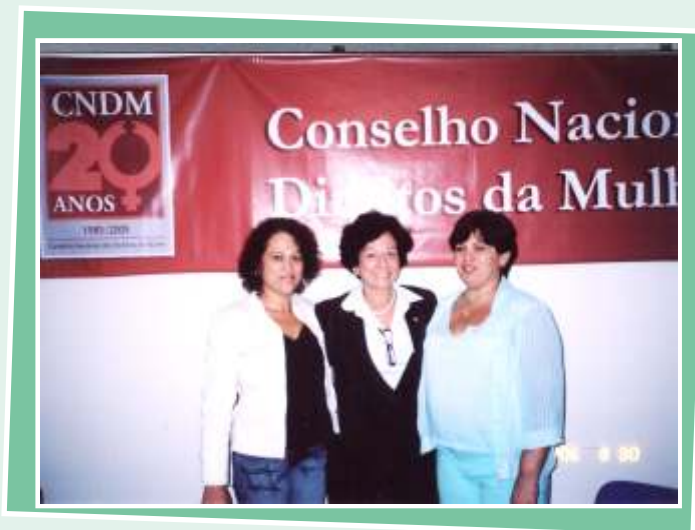
20 Anos do Conselho Nacional dos Direitos da Mulher/2005