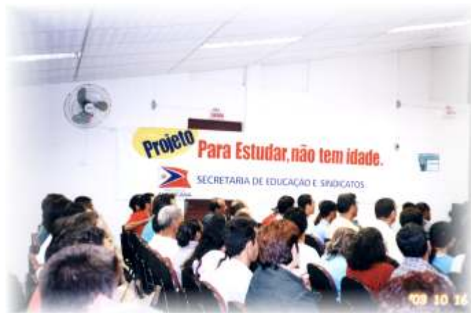
Participação do SEAAC no Projeto para Estudar não tem Idade

Temos orgulho da entidade que estamos construindo! O SEAAC pertence à Você!