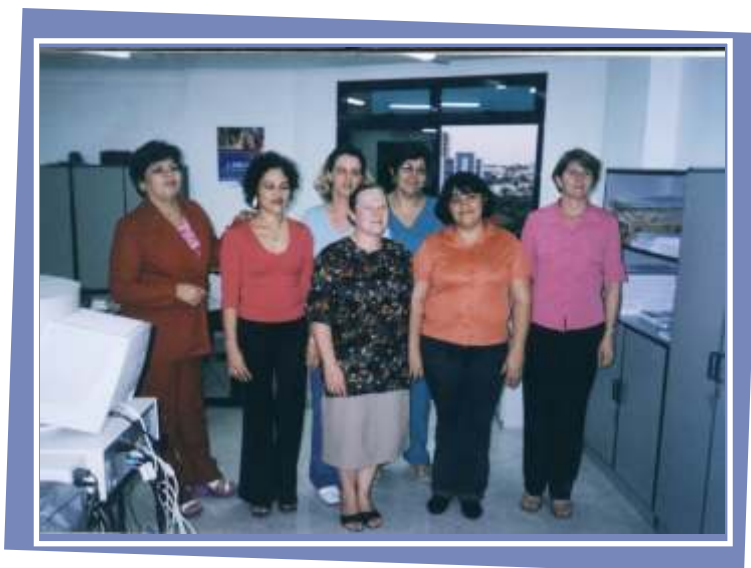
Diretoria 2º Mandato