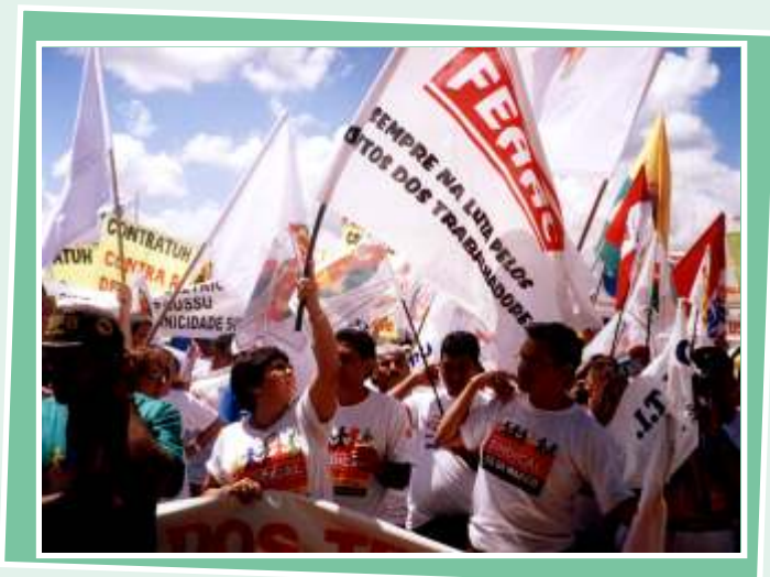
Defendendo o direito dos Trabalhadores(as)