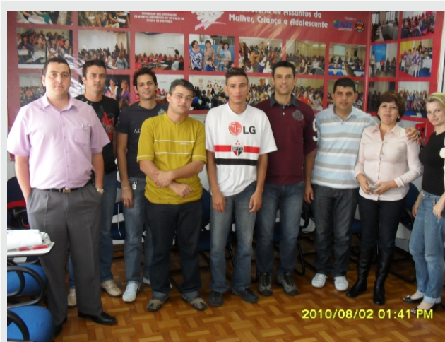
Comissão de Trabalhadores em reunião para o fechamento do PPR

Após algumas reuniões, o valor acordado entre ambas as partes e assinado em acordo Coletivo da PPR é de R$ 3.100,00 que deverão ser pagos da seguinte forma: R$ 2.000,00 em 10/08/2010 e R$ 1.100,00 em 10/02/2011. Este acordo é válido para o período compreendido entre 01 de janeiro de 2010 a 31 de dezembro de 2010. Para mais informações o acordo estará disponível na íntegra no site do Seaac: www.seaacamericana.org.br ou na sede do sindicato.