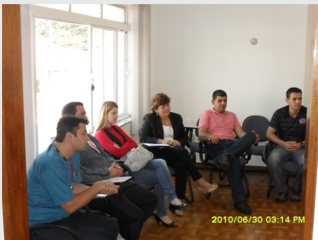
Comissão de representantes dos trabalhadores em reunião com o Seaac e a LSL para discutir a Data-Base

O Seaac busca as reivindicações da Data-Base de agosto de 2010, protocoladas em junho de 2010 junto à diretoria da LSL. As negociações já estão ocorrendo e em breve teremos novidades para os trabalhadores.